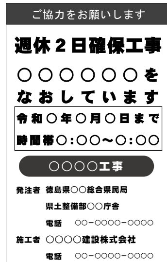
(標示板記載例) 月単位の場合